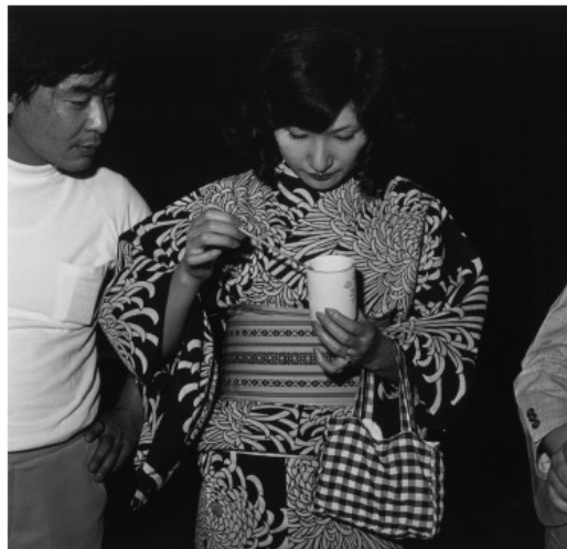
Ueno, Tokyo, 1975.

FOTOGRAFIE Een Franse uitgever selecteerde samen met de weduwe van Issei Suda 78 nooit eerder gepubliceerde foto's die de grote Japanse meester tussen 1971 en 1983 maakte in en rond Tokio.