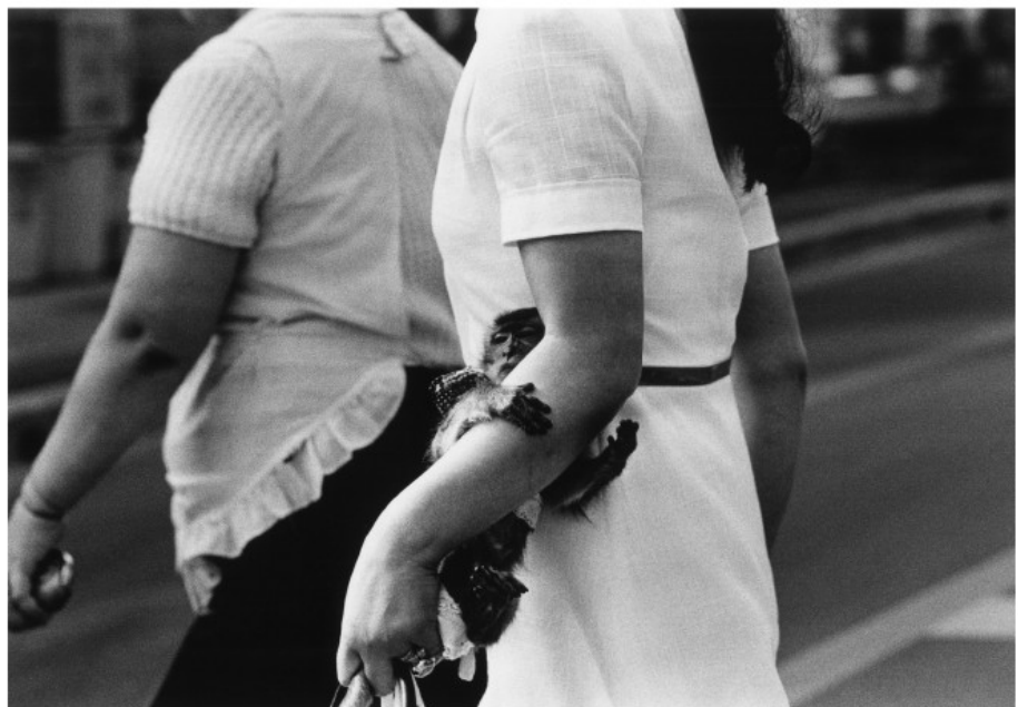
Kanuma, Tochigi, 1973.