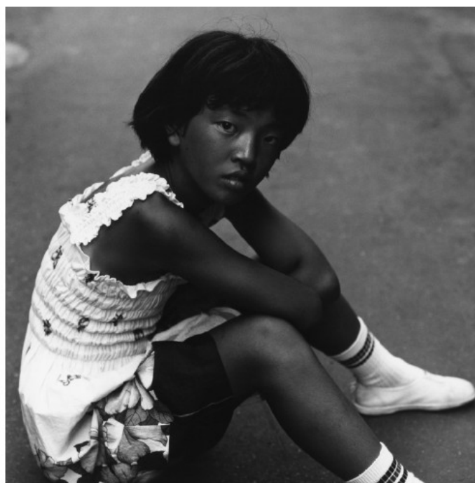
Takasaki, Gumma, 1978.