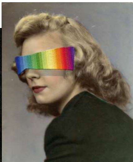
© Julie Cockburn, courtesy of Flowers Gallery / Chose commune.